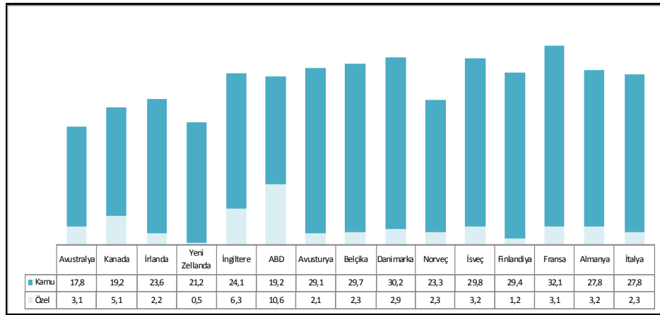
Şekil 1: Bazı OECD Ülkelerinin 2009 İtibariyle Özel ve Kamu Sosyal Harcamalarının GSYİH İçindeki Payı (%)